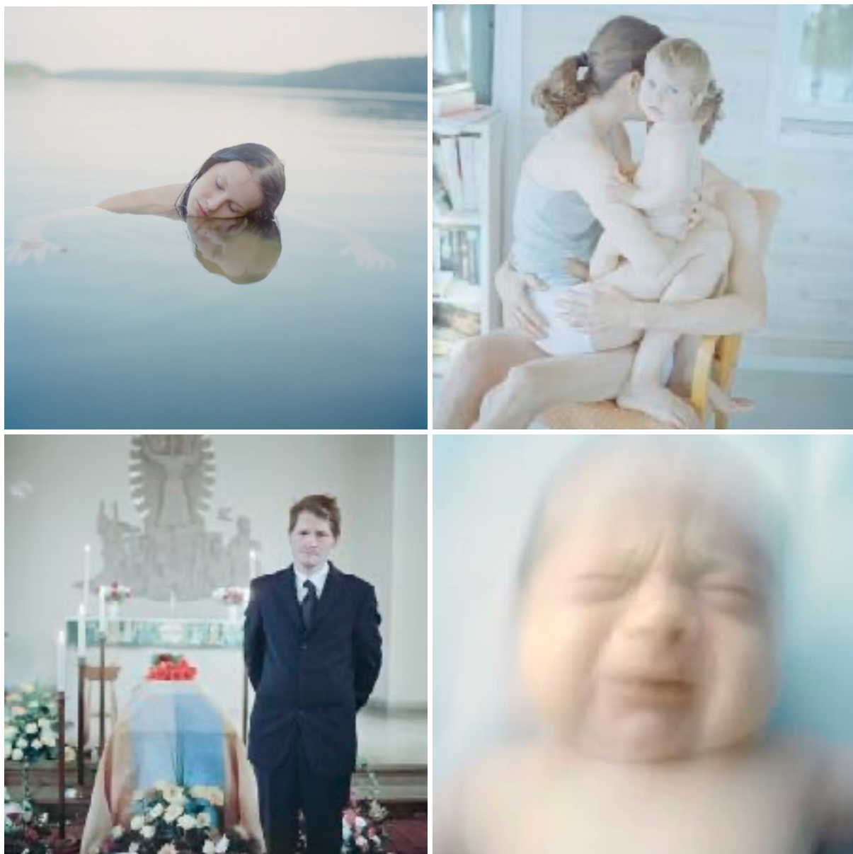
från projektet "Close to home", 2013.