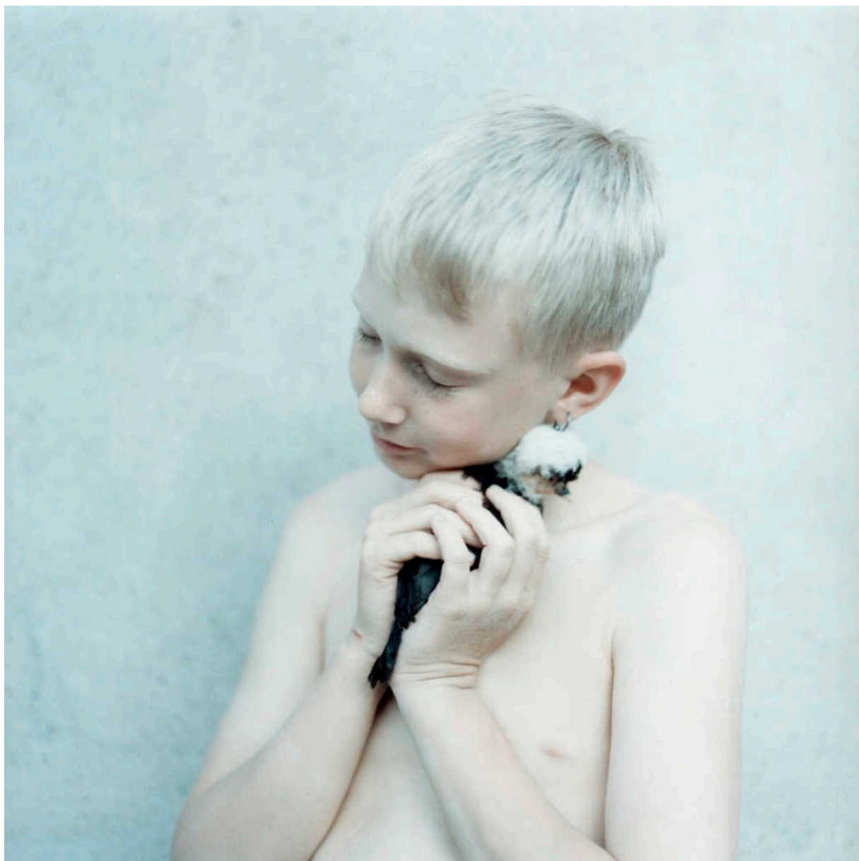
© Anna Clarén, från projektet "Holding", 2006.