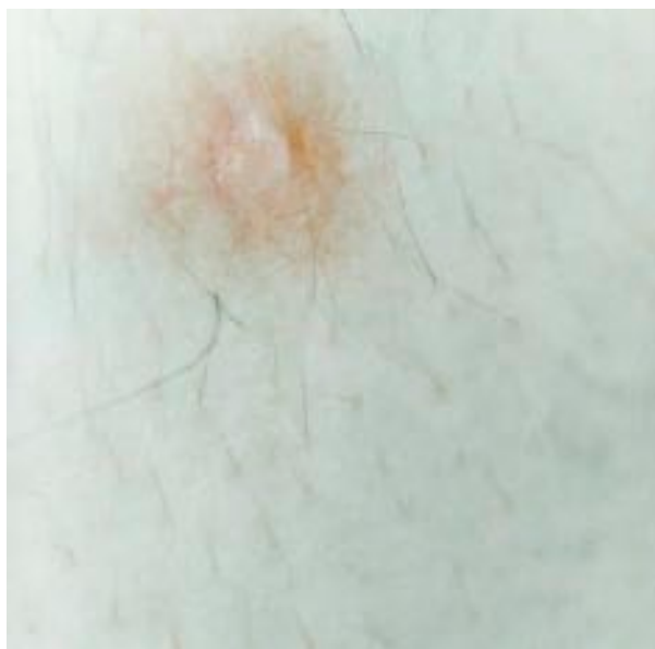
© Anna Clarén, från projekten "Close to home" (2013) och Holding (2006).